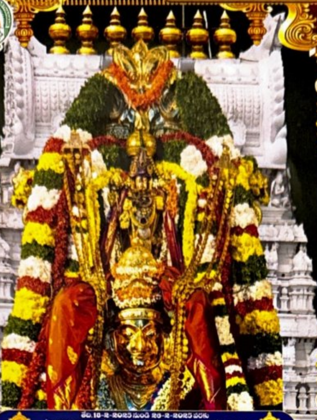
శం. 18-2-2025 నుండి 28-2-2025 వరకు శ్రీనివాసమంగాపురం శ్రీ కల్్యాణ వేంకటేశ్వరస్వామి వారి వార్షిక ప్రత్యేక కార్యక్రమాలు