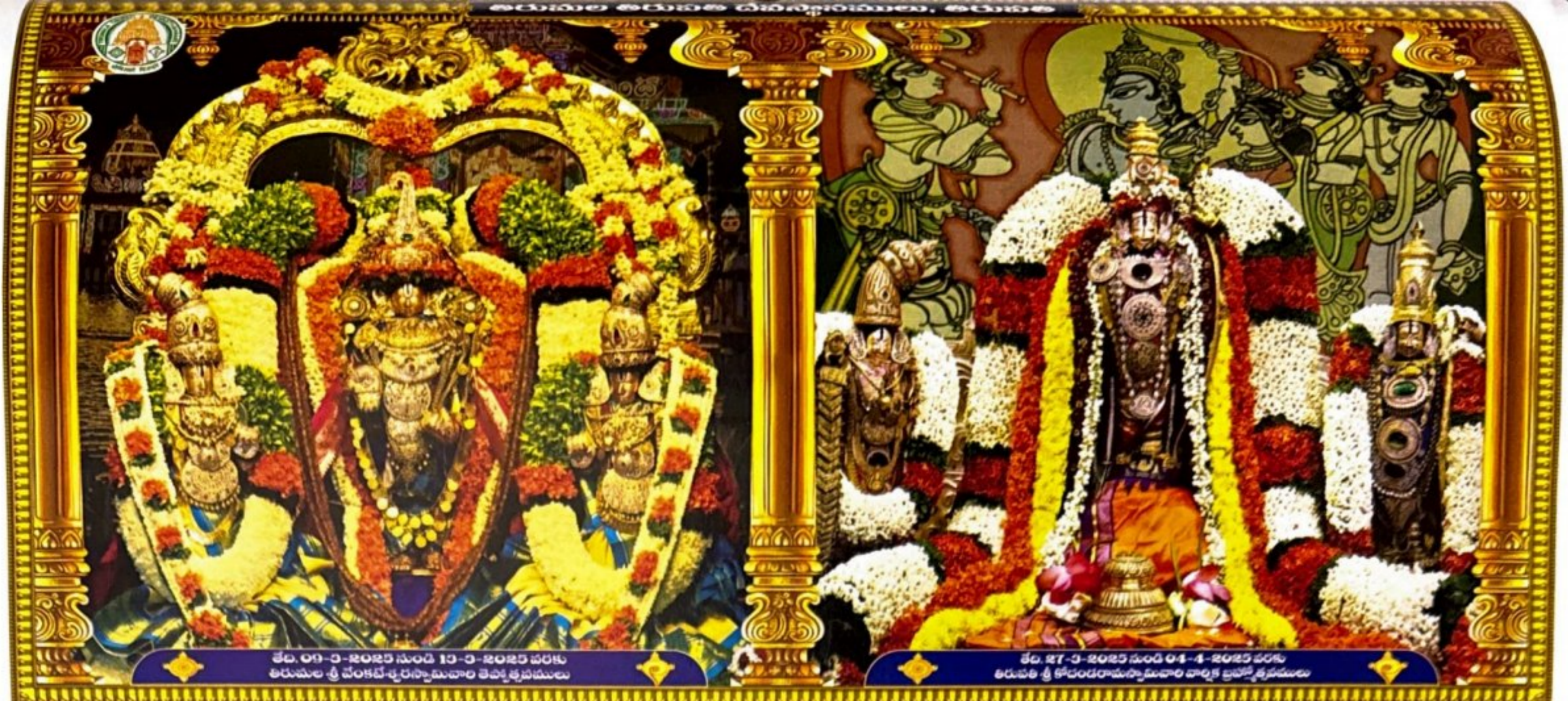
తే. 09-3-2025 నుండి 13-3-2025 వరకు తిరుమల శ్రీ వేంకటేశ్వరస్వామివారి తెచ్చి త్రవములు