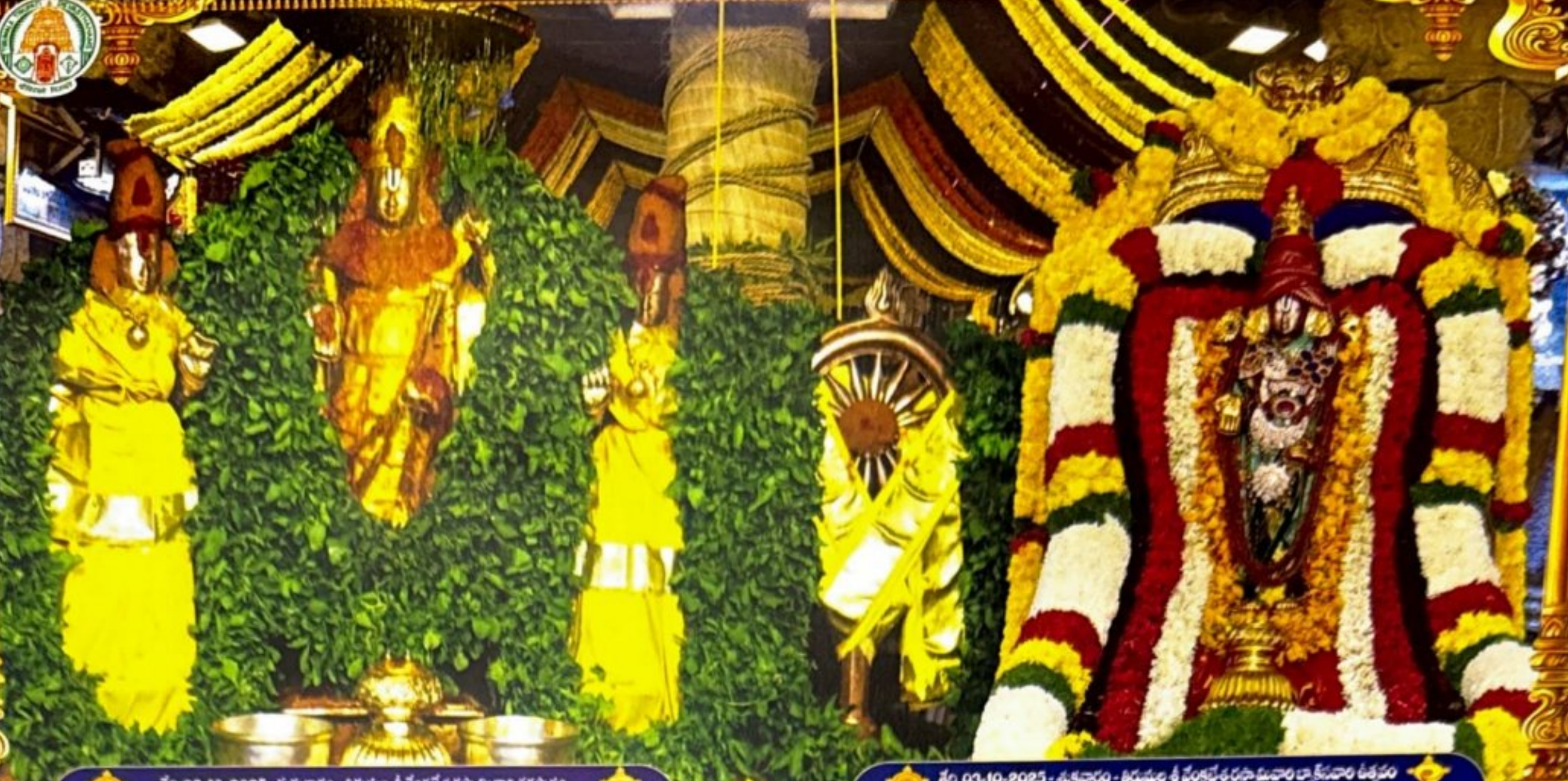
తే. 02-10-2025 - గురువారం - తిరుమల శ్రీ వేంకటేశ్వరస్వామివారి దర్శనం